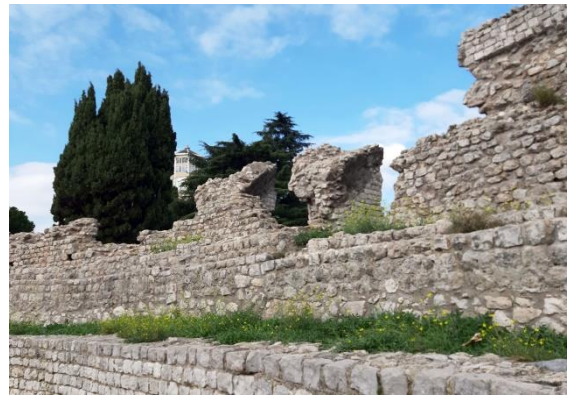
Arènes de Cimiez

Das Musée Matisse in Cimiez hat noch geschlossen, aber auch ein Besuch des dortigen Amphitheaters ist lohnenswert: