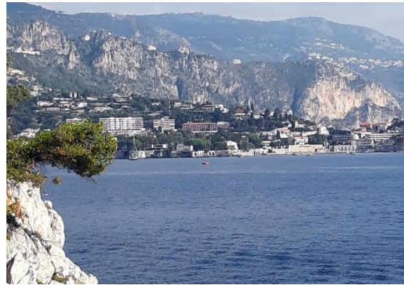
Blick auf Villefranche-sur-Mer

Bus, Ligne 15, etwas erhitzte aber glückliche Wanderer zurück nach Nizza: