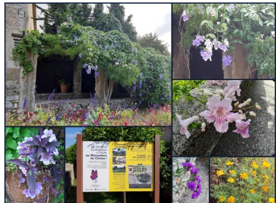
Jardin du Monastère de Cimiez

Ein kleines Paradies findet man im benachbarten ökologischen Kloostergarten: