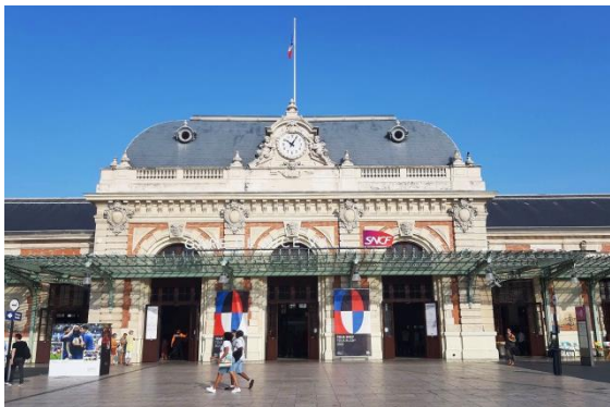
Gare de Nice, im Rugby World Cup Outfit

Mit der Tram L2 gelangt man schnell in die Stadt. Das Hotel liegt zentral, zwischen dem Place Masséna und dem Bahnhof: