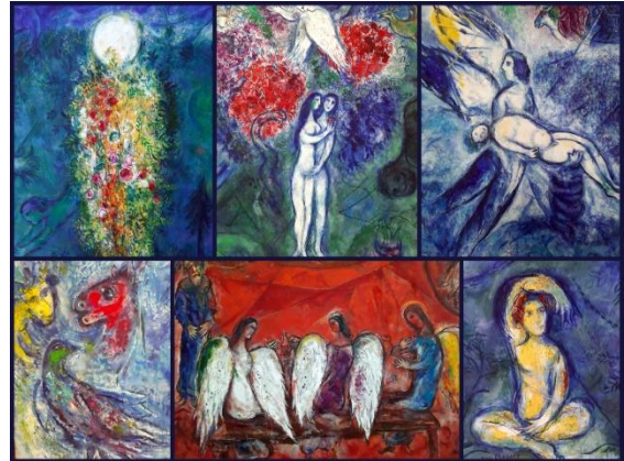
Motive im Musée Chagall

Getränkekontrolle werden die glücklichen Besucher durch große Wandbilder mit farbenfrohen christlichen Motiven bezaubert: