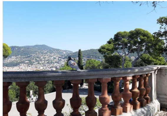
Blick auf das Hinterland von Nizza

Steigt man die Treppen zum Schlossberg hoch, wird man mit einem schönen Blick belohnt: