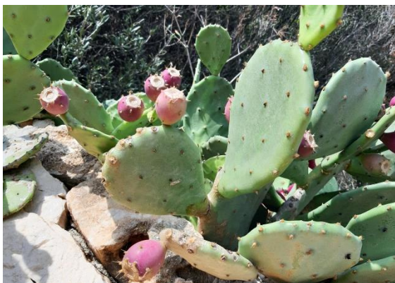
Kaktusfeigen am Wegesrand

Auf der Wanderung kann man auch die mediterrane Vegetation bewundern: