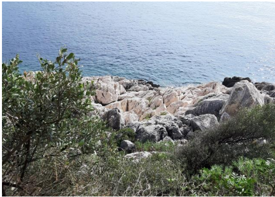
Wilde Côte d'Azur

wandern. Dieser Teil des alten Zöllnerwegs führt an der Küste nach Villefranche-sur-Mer: