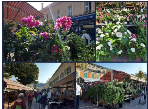
Marché aux Fleurs

In der Altstadt, Vieux Nice, kann man samstags den Blumenmarkt besuchen. Dort findet man lokale Köstlichkeiten, Herbs de Provence, Seifen und viele bunte Blumen: