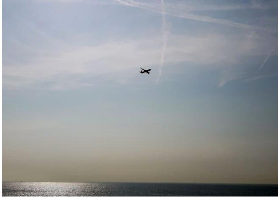
Auf dem Weg zum Aeroport de Nice

Mit einem spektakulären Landeanflug über dem Meer nähert man sich der Metropole: