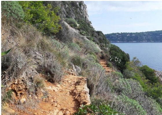
Auf dem Sentier du Littoral

Es ist heiß und sehr sonnig, man trifft nur auf wenige Wanderer oder sportliche Jogger: