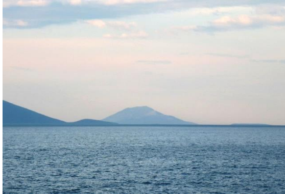
Lošinj bei Sonnenaufgang

Früher Morgen in der Kvarner Bucht. Von Brestova fährt eine Fähre zur Insel Cres. In der Ferne sieht man schon die Insel Lošinj: