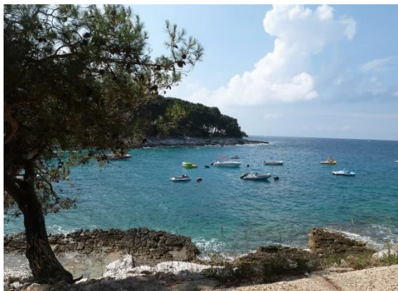
Sunčana Uvala, die Sonnenbucht

In Osor überquert man schließlich den Kanal zur Schwesterinsel Lošinj. Reiseziel ist eine malerische Bucht in der Nähe von Mali Lošinj: