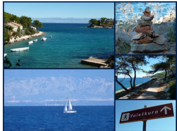
Auf dem Valeškura

Meer entlang nach Veli Lošinj. Am Wegrand sieht man Schilder für Fitnessübungen und Steinmännchen: