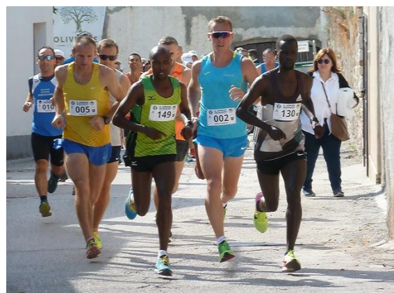
Startläufer des Lošinj Halbmarathons

Im Ort gibt es Kapitänshäuser, Konobas und das Blue World Institute für Delphinschutz. Im Herbst findet der Insellauf statt: