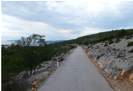
Auf der Insel Cres

Auf Cres führt eine schmale Straße durch die karge und wenig besiedelte Landschaft: