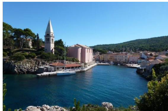
Blick auf Veli Lošinj

In Veli Lošinj wird man am Ortseingang von der rosafarbenen Kirche Sv. Antun begrüßt: