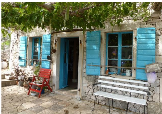
Shop im Kräutergarten

Am Ortsende von Mali Lošinj liegt der kleine Kräutergarten. Im angegliederten Shop kann man aromatische Öle erwerben: