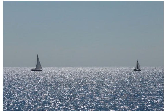
Meerblick aus der Borik Bar

Hier liegt in einem schattigen Pinienhain ein schönes Wellnesshotel. Man kann am Strand entspannen, im glasklaren türkisblauen Meer baden oder schnorcheln. Und in der nahe gelegenen Borik Bar bei Lounge Music und einem kühlem Glas Weißwein chillen: