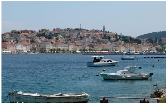
Blick auf Mali Lošinj

Still ist es hier zur Mittagszeit, nur wenige Menschen kommen dem Wanderer entgegen. Geht man den Berg wieder hinab, gelangt man nach Mali Lošinj, dem größten Ort der Insel: