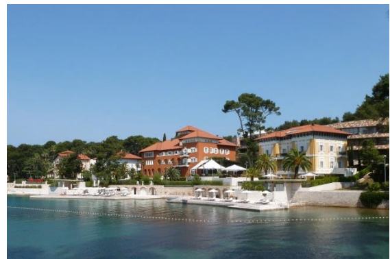
In der Čikat Bucht

Auf dem Küstenweg lässt sich die Insel gut erkunden. In der benachbarten Čikat Bucht findet man mondäne Hotels und Villen: