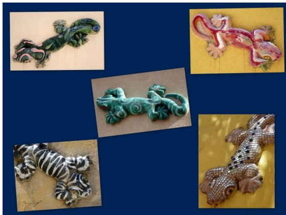
Mazaklin, der Gecko

Hier treffen sich Einheimische, Touristen und Segler. Auf den Hauswänden sieht man das Wahrzeichen der Insel farbenfroh abgebildet: