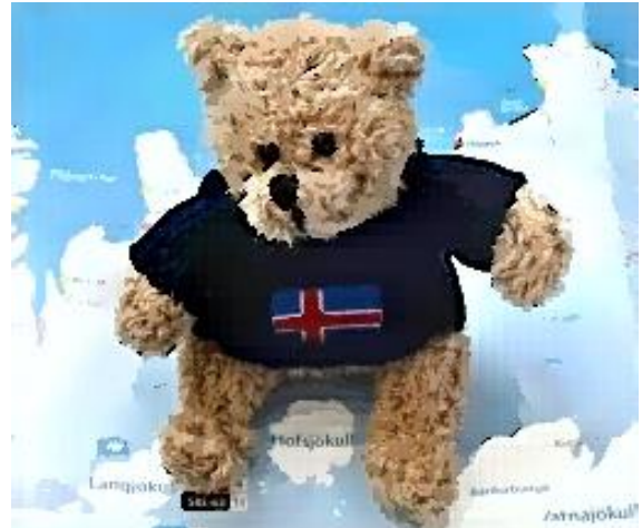
Magnus aus Island

einem Island-Pullover dasitzt und sie intensiv ansieht: